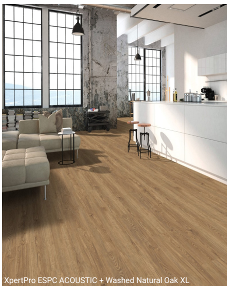
XpertPro ESPC ACOUSTIC + Washed Natural Oak XL