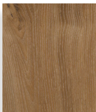
Washed Natural Oak XL 18201e