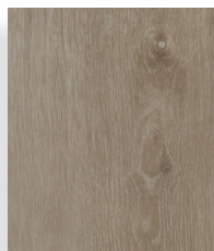
Warm Cottage Oak XL 18142e