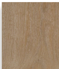
European Oak XL 18200e