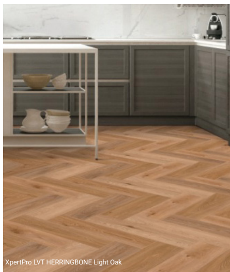
XpertPro LVT HERRINGBONE Light Oak