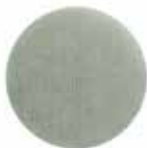
Bona Net Alox

Fremstillet af hvid aluminiumoxid. Nettene er udviklet til medium og fin afslibning. Den specielle netstruktur sikrer støvfri afslibning samtidig med effektive slibeegenskaber. Ø 150 mm, K 80 – 100 – 120. Perfekt til afslibning med Bona FlexiSand, Bona Supraflex, Festo Rotex og lign.