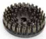
NEB Metal brush

Bagskive til Power Drive NEB til traditionel afslibning