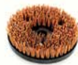
NEB Tynex brush

Metalbørste til Bona Power Drive NEB til frembringelse af børstet træ. Der skal monteres ekstra vægte på FlexiSand 1,9 for at opnå den rette effekt.