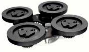
Bona Power Drive NEB