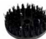
NEB Resilient Brush

Anvendes efter metalbørsterne for at opnå en mere "soft" overflade.