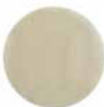
Bona Net Keramisk

Fremstillet af keramisk aluminiumoxid. Nettet er konstrueret til medium afslibning og fjernelse af træfjerner som f.eks. Bona Mix & Fill Plus. Net keramikrondel er også meget velegnet til afslibning af halvhårde gulvbelægnings i forbindelse med anvendelse af Bona Elastic System. Den specielle netstruktur og de keramiske korn sikrer effektiv afslibning og lang levetid. Ø 150 mm, K 80