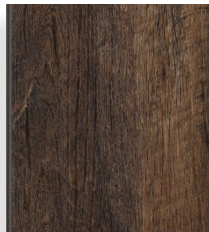
Dark Oak 8994