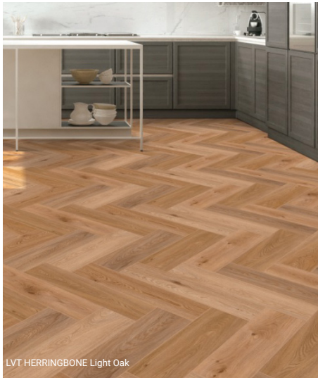
LVT HERRINGBONE Light Oak