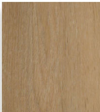
Light Oak 15322

Se montagevejledningen på scandinova.dk .